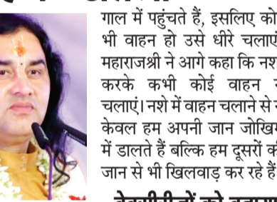
वेबसीरीजों को बताया समाज का दुष्मान