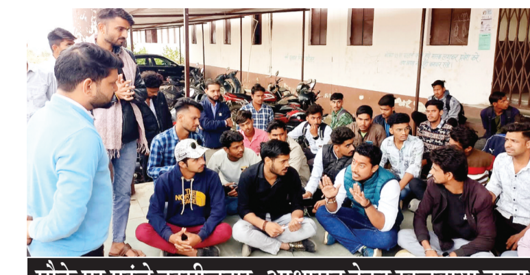
मौके पर पहुंचे तहसीलदार, आश्वासन देकर खुलवाया ताला